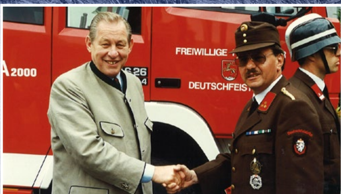
„Und damit dieses sündhaft teure Fahrzeug nur mehr teuer ist, gebe ich noch einmal 500.000 Schilling hinzu!“ Mit diesen Worten stellte der damalige Landeshauptmann Josef Krainer jun. das neue RLF-A 2000 im Jahr 1995 in den Dienst