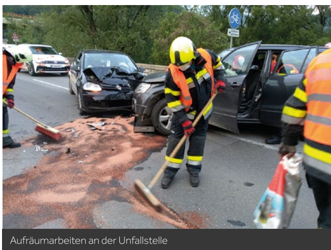
Aufräumarbeiten an der Unfallstelle

Am 17.05.2020 waren 2 PKW auf Höhe der Murbrücke zwischen Deutschfeistritz und Peggau frontal kollidiert. Dabei wurden zwei Personen unbestimmten Grades verletzt.