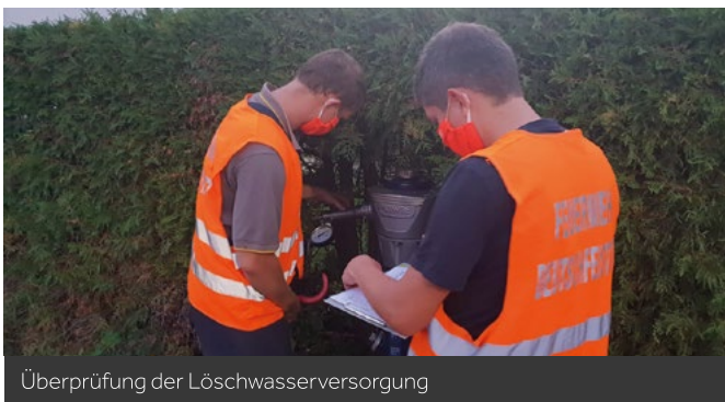
Überprüfung der Löschwasserversorgung

Die Durchführung der Überprüfung der Löschwasserversorgung sollte die einzige gemeinsame Gesamtübung im Jahr 2020 werden. Auf Grund der coronabedingten Beschränkungen waren weder davor noch danach größere Übungen erlaubt. Unter strenger Einhaltung der erforderlichen Schutzmaßnahmen führten 26 Kameradinnen und Kameraden am 14.09.2020 die Kontrolle der Löschteiche und Löschwasserbehälter sowie des Hydrantennetzes durch.