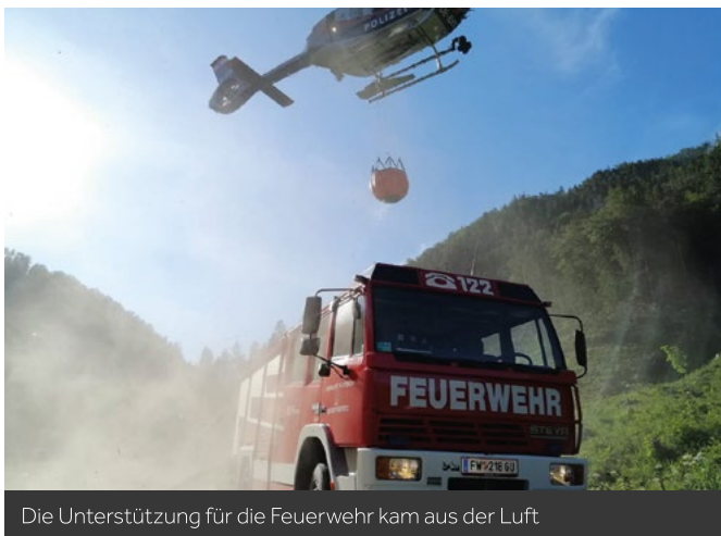
Die Unterstützung für die Feuerwehr kam aus der Luft

Am 12.06.2020 brach im Walchergraben in Stübing in unwegsamem Gelände ein großflächiger Waldbrand aus. Der Brand hielt die Feuerwehren 3 Tage lang in Atem.