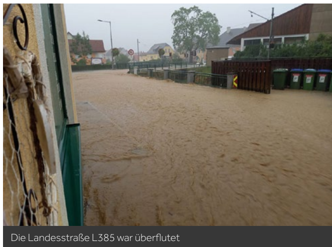
Die Landesstraße L385 war überflutet

Am 29.07.2020 wurde Deutschfeistritz von einem schweren Unwetter getroffen. Insgesamt mussten 31 Schadenslagen abgearbeitet werden.