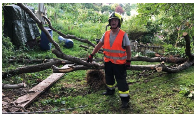
Wolfgang bei Aufräumarbeiten nach Unwetterschäden im Jahr 2020