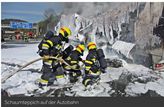
Schaumteppich auf der Autobahn

Am 16.04.2020 geriet ein Sattelschlepper auf der A9, Pyhrnautobahn in Brand. Das Zugfahrzeug konnte geschützt werden, der Sattelaufleger hingegen brannte vollständig aus.