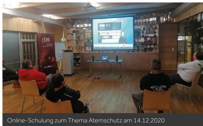
Online-Schulung zum Thema Atemschutz am 14.12.2020

Bekannte Sprichwörter lauten: „Not macht erfinderisch“, oder „aus der Not eine Tugend machen“. Wir haben uns daher der schwierigen Zeit im Jahr 2020 angepasst und haben begonnen, theoretische Ausbildungen über das Internet mittels „Live-Stream“ durchzuführen. Entweder wurden diese virtuellen Übungen in geringer Personenanzahl im Schulungsraum unter Einhaltung aller gültigen Schutzmaßnahmen (wenn erlaubt) abgehalten oder sie wurden von den Feuerwehrmitgliedern von zu Hause aus über das Internet verfolgt. Damit hat eine neue Ausbildungsmethodik Einzug bei unserer Feuerwehr gehalten.