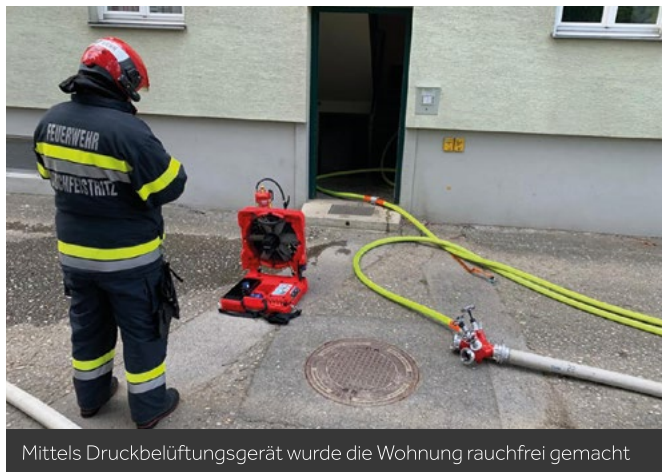
Mittels Druckbelüftungsgerät wurde die Wohnung rauchfrei gemacht

Zimmerbrand in einer Wohnung eines Mehrparteienhauses in Peggau.