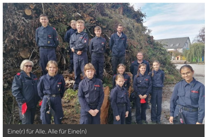
Eine(r) für Alle, Alle für Eine(n)