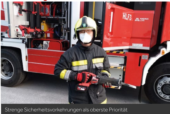
Strenge Sicherheitsvorkehrungen als oberste Priorität

Mitten hinein in den ersten Lockdown und der damit verbundenen Ausgangsbeschränkungen wurde unser neues HLF3 (als Ersatz für das alte RLF-A 2000) in den Dienst gestellt. Es wurde eine intensive Einschulung auf das neue Fahrzeug mit den darin befindlichen (teilweise neuen) Ausrüstungsgegenständen und technischen Geräten für die Mannschaft vorgenommen, damit wir schnellstens mit dem neuen Fahrzeug die Einsatzbereitschaft herstellen konnten. Im Frühjahr und Sommer führten wir somit in Kleinstgruppen die Ausbildung für das neue Einsatzfahrzeug durch.