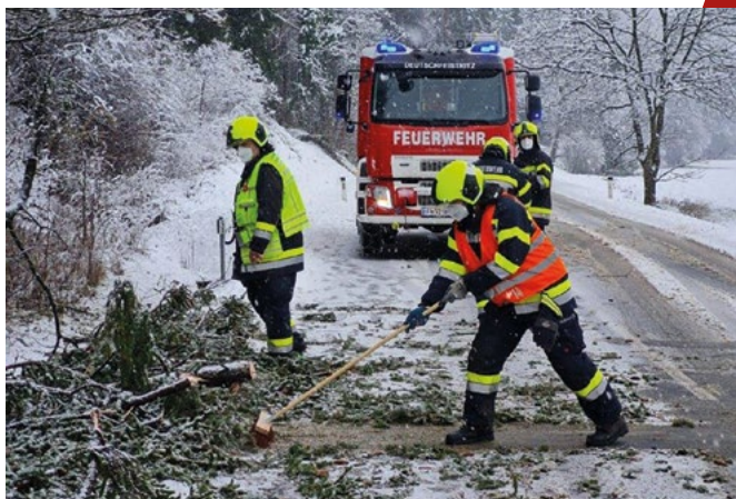
Aufräumarbeiten nach Schneebruch

Hervorgerufen durch starken Schneefall waren am 09.12.2020 im Ortsteil Waldstein mehrere Bäume umgestürzt.