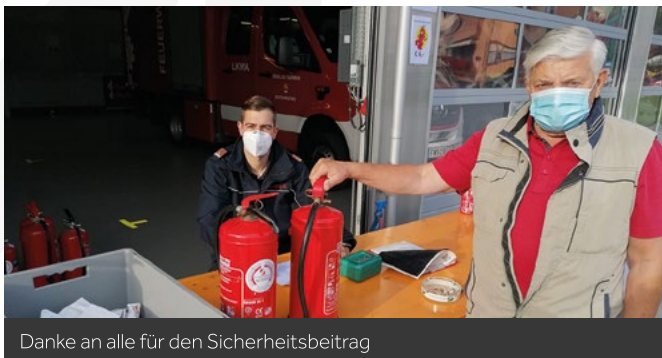
Danke an alle für den Sicherheitsbeitrag

Gerade noch rechtzeitig, bevor seitens der Regierung abermals verschärfte Covid-19-Maßnahmen in Kraft traten, konnten wir gemeinsam mit der Firma Konrad am 19.09.2020 die Feuerlöscherüberprüfung für die Bevölkerung von Deutschfeistritz über die Bühne bringen.